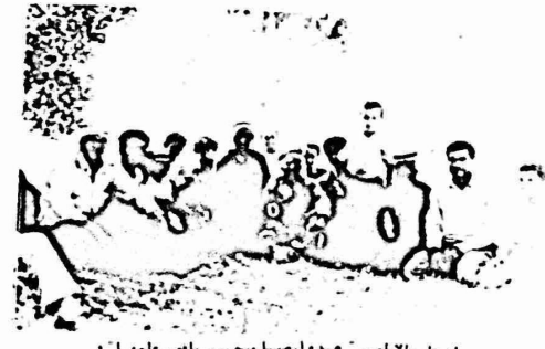
اصحاب الاراضي - هذه ارضنا وحسن باون طلبنا

مارس املاك الغائبين يبلغ الحاضرين بمصادرة اراضيهم !!