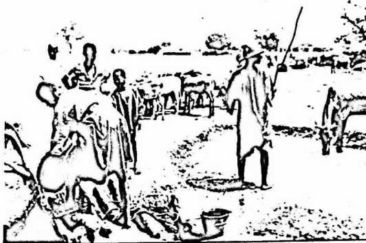
الزراعة المتخلفة من بقايا الماضي الاستعماري ..

وهي نفوذ النشاط التعليمي ومحو الامية وتنظيم العمل الجماعي. وبغوم الالات من المواطنين بالاشتراك في الاعمال التطوعية لاصلاح الطرق وتنظيف القنوات وحفر الالبار، وفي المناطق الريفية تحاول هذه اللجان تنظيم الفلاحين للقيام بالاعمال الجماعية ايضا، وبغول المظلمون هناك ان هذه اللجان تلعب دورا مهما جدا في تعمير اسلوب التفكير الموروث وتعلم الناس كيف يعتمدون على انفسهم دون انتظار المساعدة الخارجية.