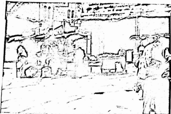
حاليه سسر الحسبه سس الحليل

مدخل الخليل الشمالي وفي الععدد من المناطق الخاصه لدائره التنظم، وكان هدف رفض توسيع حدود البلدية سابعا هو عدم نعكس بلدية الخليل المنتمه من اعطاف رخص بنا، وسببيل الخدمات البلدية في حدودها الموسعه وبالتالي سفا، مناطق ساسعه في الخليل خاصه لدائره التنظم وسلطه المستوطنن.