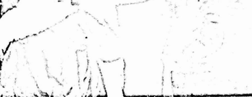
المستوطنون يبرصون الشمال المغرب عند الحواجز التي اقاموها في الاسوع الماضي

لكن الذي جرى هو اصحاز اتس من المستوطنين وهما : ناروخ مارزل سكرتير حركة كاخ الصهيونية في الكيبست الاسرائيلية ، وزوجي مداد ، لليلسن فقط واطلاق سراحهما بعد ذلك . صحيفة هارتس على هذا السلوك بقولها "عندما يدور الحديث عن المستوطنين تكون يد القانون (الاسرائيلي) مرنه الى حد انعدام فاعليتها!!