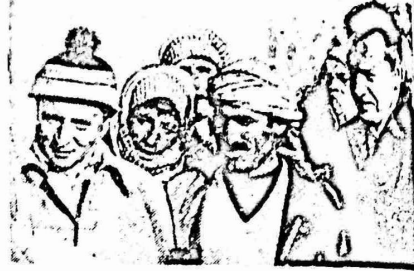
هذه السوفيت للاتونوف وبولديريف يتدلمن مع عمال البند السورين في مشقة سد الترات (الجمهورية العربية السورية)

لدى صانعه امكاسه وحدوى التعاون مع الاتحاد السوفيتي في بناء المصنع الصناعي في أدجاوكت" كنت حريده "بأحرارنا سو" السحرية نقول