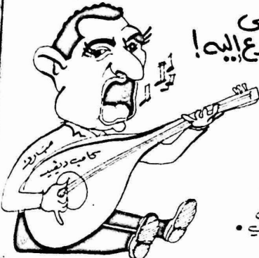
إعادة صرخة الضفء العزيب