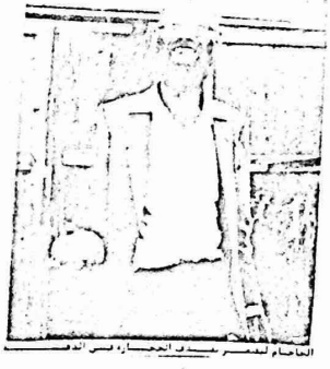
الاصحاب المصطفى في الجمارا في بيت الله