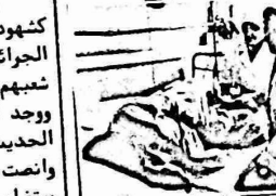
اطباء سوفيت يعالجون الجرحى الفلسطينيين في لبنان.