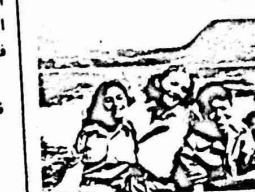
اطفال فلسطينيون في مخيم طلائع الشباب الوطنيين في ارتك على البحر الاسود مع الاف من الاطفال من دول عديدة.