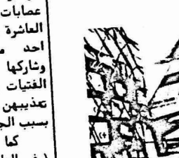
طائرة سوفيتية في مطار دمشق تحمل المساعدات الطبية والغذائية والملابس للاجئين الفلسطينيين مقدمة من المنظمات السوفيتية.

الدخل في شؤون الدول الاخرى واستخدام القوات العسكرية والمرتزقة ودعم القوى الرجعية والعملاء والمعادمة للنزوة كل هذه هي جزء من الاسرائيلية الامبريالية وعلى رأسها الامبريالية الامريكية لصرب حركات التحرر والمعدم ونزوات السورب .