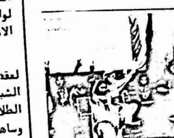
فرقة فولكلورية فلسطينية في موسكو.