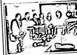
وقد من لجنة التضامن والامم المتحدة السوفيتية بزرور محفل لسنس التذكاري في الكرملين.