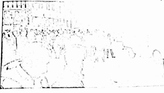
في محطة باصات باب العامود بانتظار من يشتري قوة عملهم

وقد ذكرت "الجروساليم بوست" ذلك صراحة في عددها يوم ١١/٢٣ ، حين كشفت زيف الادعاء بعدم وجود تمييز ضد ( عمال المناطق العرب ) وقالت ان الحقيقة هي ان اخراذ ان خطط الحكومة والهستدروت تؤكد اللجوء الى تخفيض عدد العمال الاجانب ممن فيهم اولئك الذين يعملون من الضفة والقطاع بدون تصاريح ولقد طمان منسق المناطق