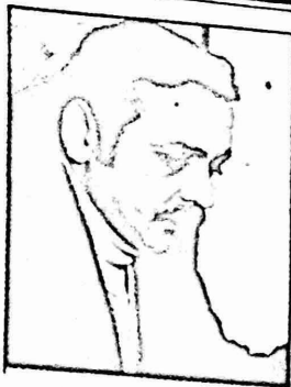
ياسر عبد ربه