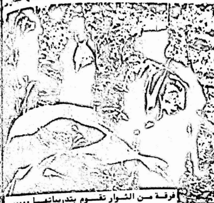
فرقة من الشوار تقوم بتدريبها

شخصيات اخرى الكنيسة العامة في البلاد حادة اضطرت العسكرية منها اجراءات تتخذ من عن فطاعات الطمير الاقتصاد اذ اصحابها علميات صندوق النقد ضرائب جديدة على الصناعة والمستهلكون والعمال هم كبار ملاكي الارض كما تمكن من الحش الداخلي للصورة للضباط في الراي ، اد لاطلاق الذين يعون في الصل