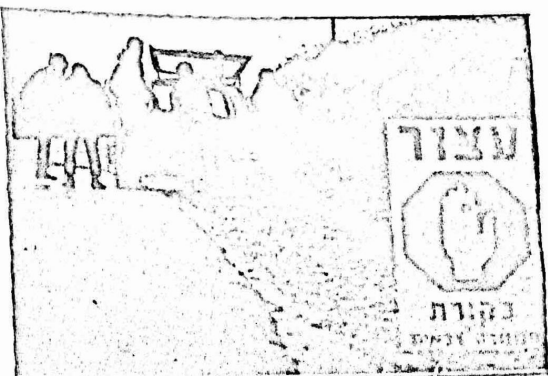
منعت السيارات من الدخول الى حرمي جامعتي بهرزيت، ومعهد البوليتكنيك في ذكرى وعد بلقور، وفي الصورة سيارة عند احد الحواجز على مدخل بهرزيت.

وفي الخليل اعلن طلاب معهد البوليتكنيك الاضراب عن الدراسة وكانت سلطات الاحتلال قد وضعت الحواجز على الطرق المؤدية الى المسجد كما منعت الطلاب والمدربين من الدخول اليه. وفي البلدة القديمة بالقدس، رشق الشبان الجنود الاسرائيليين بالحجارة ورد عليهم الجنود باطلاق النار في الهواء. وفي مخيم بلاطة للاجئين / نابلس تعرضت دورية اسرائيلية واجلة للرشق بالحجارة وقام افرادها بملاحقة الشبان الى داخل المخيم واعتقال احدهم. وقامت قوات الاحتلال بوضع