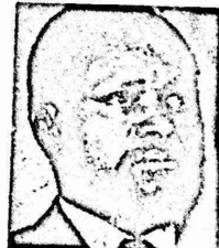
— سامورا ميشيل —

ونشر اليوم الجزء الثاني من كتابه "عبد العظيم انيس وموتنوا: بين الثقافة والسياسة - من هو جيمس هوكر ؟!