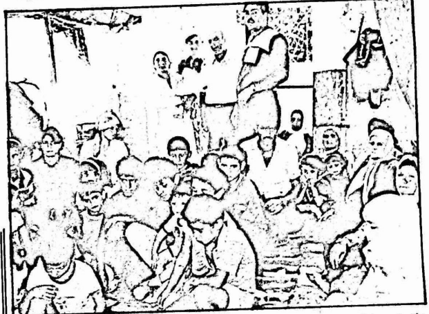
الاعتصام الاحتجاجي الذي شهدته بلدة الرام في آب/٨٦ ضد سياسة الاغلاق