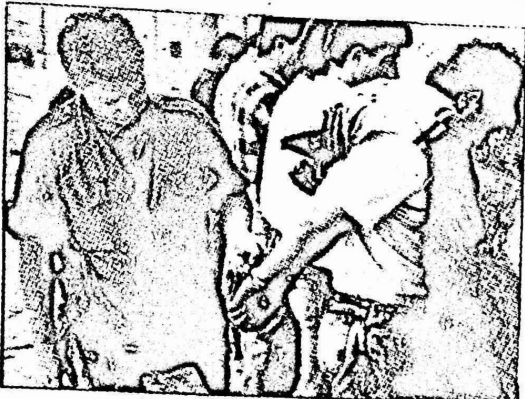
المكان مخيم شعفاط .. الزمان : الخميس ١٥/١٠ . الموضوع :

تجددت المظاهرات الشعبية في مختلف مدن ومخيمات الضفة وقطاع غزة . وندد المتظاهرون بالموقف الاميركي وبالمارسات الاسرائيلية ضد المواطنين . ووصلت المظاهرات ذروتها عشية وصول جورج شولتز وزير الخارجية الاميركي ال اسرائيل مساء الجمعة الماضي . واعترف الناطق العسكري الاسرائيلي بوقوع مصادمات عنيفة بين الجنود الاسرائيليين والمتظاهرين الذين رفعوا الاعلام الفلسطينية في اكثر من مناسبة . وافادت الابناء ان الجيش الاسرائيلي لجأ ال القوة لتفريق المظاهرات . واصيب عشرات المواطنين بجروح ، كما جرى اعتقال اعداد كبيرة منهم .