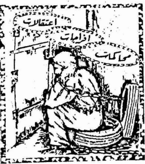
رفض السماح باجراء فحص طبي لمعتقلة

نظرت المحكمة، يوم الاثنين الماضي، في المذكرة التي قدمتها المواطنة نائلة عايش حول أسلوب التحقيق الذي اتبع معها والذي ادى الى اجهاضها، ولدى اعتقالها في السكوبية.