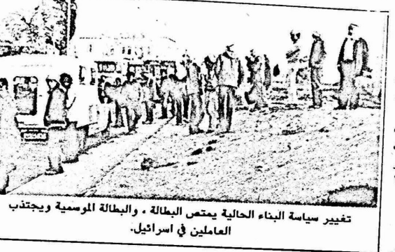
تغيير سياسة البناء الحالية يمتص البطالة ، والبطالة الموسمية ويجتذب العمالين في اسرائيل.