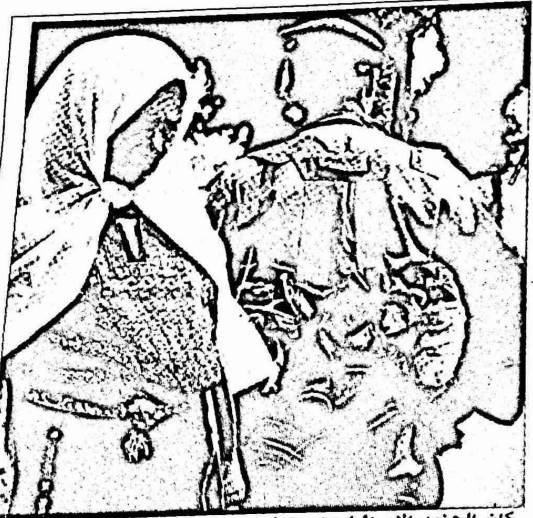
كان الجنود الاسرائيليون ينتشرون بكثافة في شوارع مدن الضفة والقطاع التي خلت تقريبا من المارة.

استقبلت جماهير الضفة الغربية وقطاع غزة بالذكرى الحادية عشرة ليوم الارض باعلانها الاضراب الشامل في عدة مدن ورفع الاعلام الفلسطينية والتأكيد على اقامة الدولة الفلسطينية المستقلة.