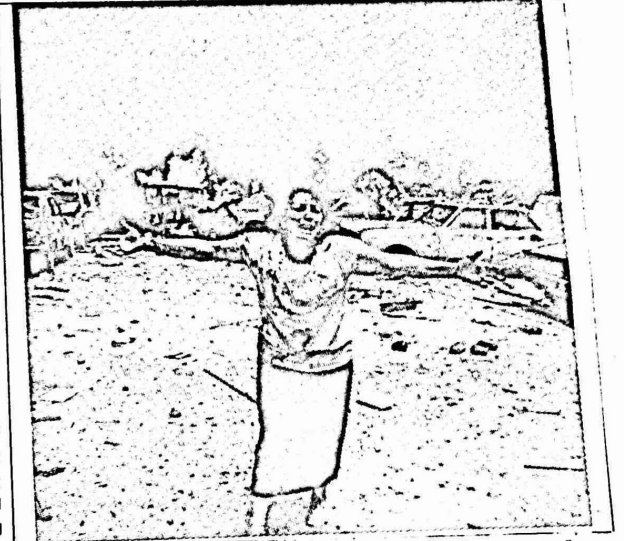
"من هنا مر القتل" مشهد يتكرر يوميا حول المخيمات الفلسطينية المحاصرة

واصلت حركة امل عدوانها ضد المخيمات الفلسطينية المحاصرة. ونشرت وكالات الأنباء احصائيات مفادها ان عدد الفلسطينيين الذين قتلوا منذ بدء تنفيذ الخطة الامنية في بيروت الغربية في ٢٢/٢/٨٧ (٤٦) شخصا (٢٧) امرأة من مخيم "برج البراجنة" و(٢٠) امرأة وستة اطفال من مخيم شاتيلا. وبلغ عدد الجرحى ١٣٦ شخصا. كما واعتبرت اربع سيدات من مخيم "شاتيلا" في هذه المقودات.