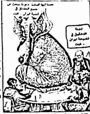
الليل هو رمز الحزب الجمهوري، حزب الرئيس ريغان كما تجدر الإشارة الى التحذير الذي وجهه فرانك غافني وكيل مساعد وزير الدفاع الاميركي، الى الدول العربية والصديقة بانه سيكون خطأ فادحا ان تتجه الالاتحاد السوفيتي للحصول على مساعدة عسكرية" تعطيلها القدرة على الدفاع عن نفسها. فهذه الاسلحة واستعمالها للذود عن السيادة الوطنية هو ما اسماء غافني "بشروط هي بالتأكيد غير مرغوب فيها من وجهة نظرنا وهي غير مرغوب فيها من ناحية المصالح الغربية...". وتصح العرب بشراء الاسلحة من السوق الغربي اذا رفض الكونغرس بيعهم هذه الاسلحة.

ونتيجة كل ذلك تتحشد الآن ٢٤ سفينة حربية اميركية بقيادة حامله الطائرات "كيتي هوك" في منطقة "مطحة الجمال" التي تبعد ٥٠٠ ميل من الخليج وحيث مضيق هرمز واهداف اخرى مجاورة تقع ضمن مدى طائرات الحاملة وبما يكفل غامشا عن الامان ضد هجوم تشنه طائرات او صواريخ من قواعد برية ضدها حسب "كريستشيان ساينس مونيتور" الاميركية. واوضح وزير الدفاع الاميركي ان هذا الوجود ضروري حتى تكون الولايات المتحدة قادرة على الاستجابة لطالبات المعونة التي قد تأتيها من الدول الصديقة التي ترى في الصواريخ الايرانية تهديدا. واوضح ان الوجود هذا ضروري حتى لو لم يفكر الايرانيون في اطلاق الصواريخ فانه يمكن "لقدرة ان تثير الرعب، فاما ان تحد من الملاحة بسرعة شديدة او ترفع نفقات التأمين ارتفاعا هائلا يكون له التأثير نفسه". وزعم واينبرغر ان على الولايات المتحدة ان تجعل من المفهوم ان "لنا القدرة والتصميم على عدم السماح باغلاق المضيق وعدم السماح بنشوء وضع لا يتيسر فيه لنا ولا للدول القريبة الوصول الى حقول النفط". وطالب غافني حلفاء اميركا المشاركة في هذه العمليات فقال انه يتوجب على الدول التي تعتمد على النفط الذي يستخرج من ذلك الجزء من العالم وتلك التي ترغب في رؤية الاستقرار يسود في الشرق الاوسط ان تدرك ان مصالحها على المحك هناك.